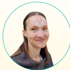
BIANCA KURS-ASSISTENZ FITNESS-COACH SCHAMANIN STEINE-FLÜSTERIN ZEREMONIEN