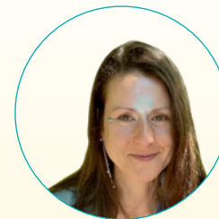
ANJA KURS-BEGLEITUNG ERNÄHRUNGS-COACH SPACE-DESIGNERIN TORTEN-ZAUBERIN ZEREMONIEN