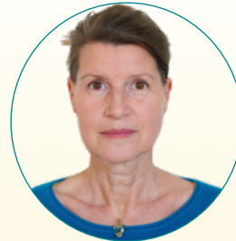
STELLA* MEDITATION & ENERGETIK MEDIALE SUPERVISORIN SYSTEMISCHER COACH CHANGE MANAGERIN GEOKULTUR COACH STERNENBOTSCHAFTERIN